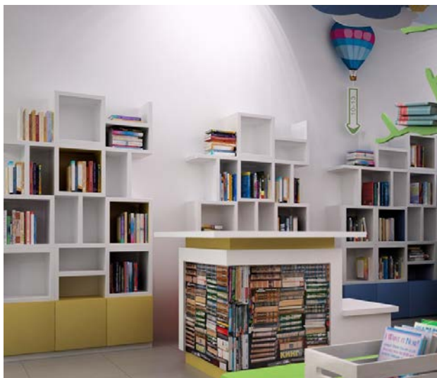
Настенные книжные полки