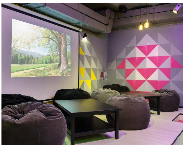
Украшение стен. Экран