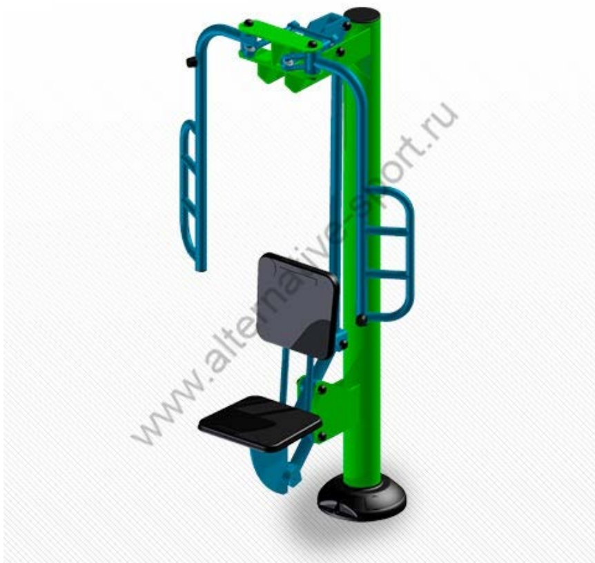
Уличный тренажер ТС-105 «Тренажер имитатор ходьбы»