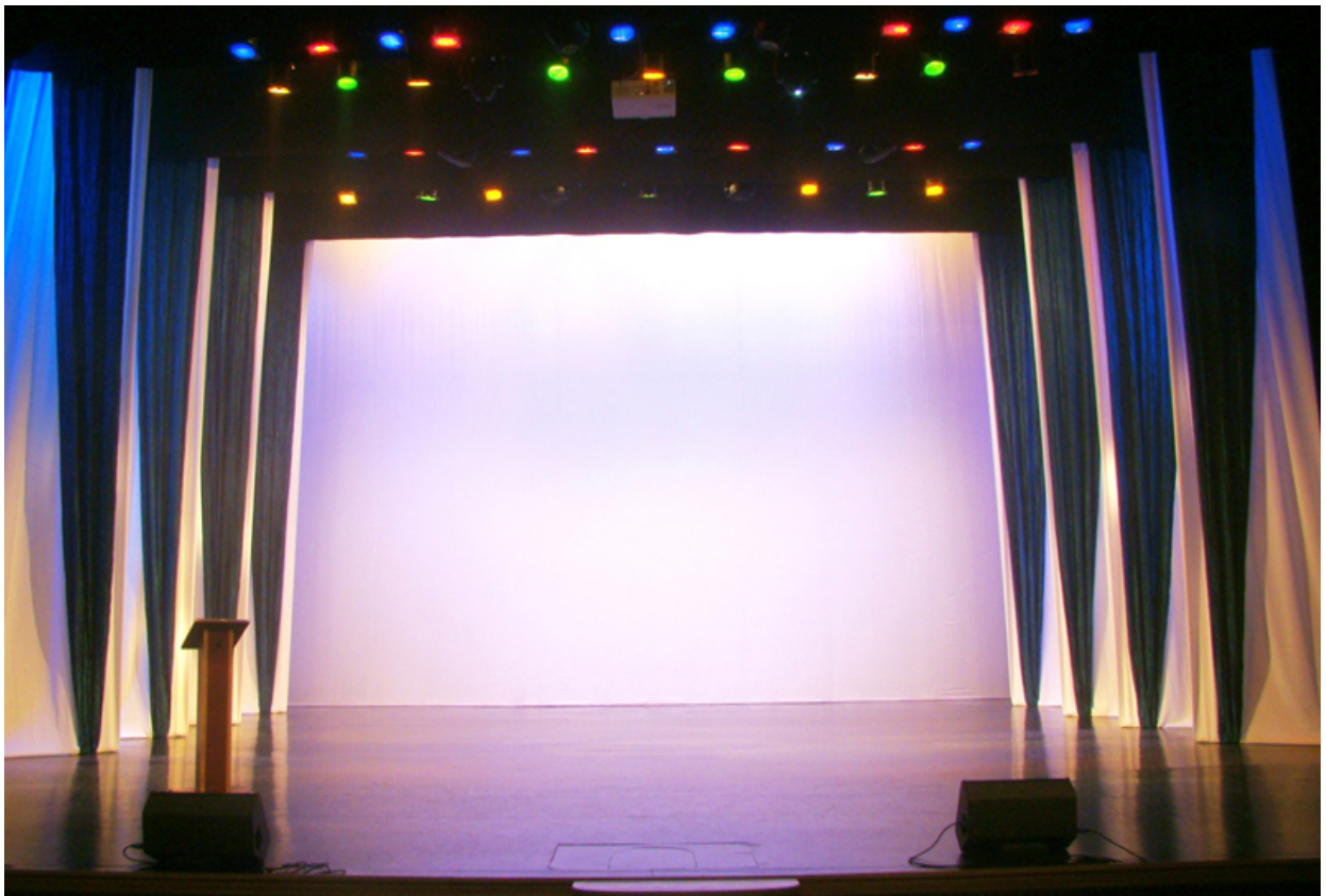
Рисунок 1 После демонтажа.

Ожидаемый результат от реализации проекта: