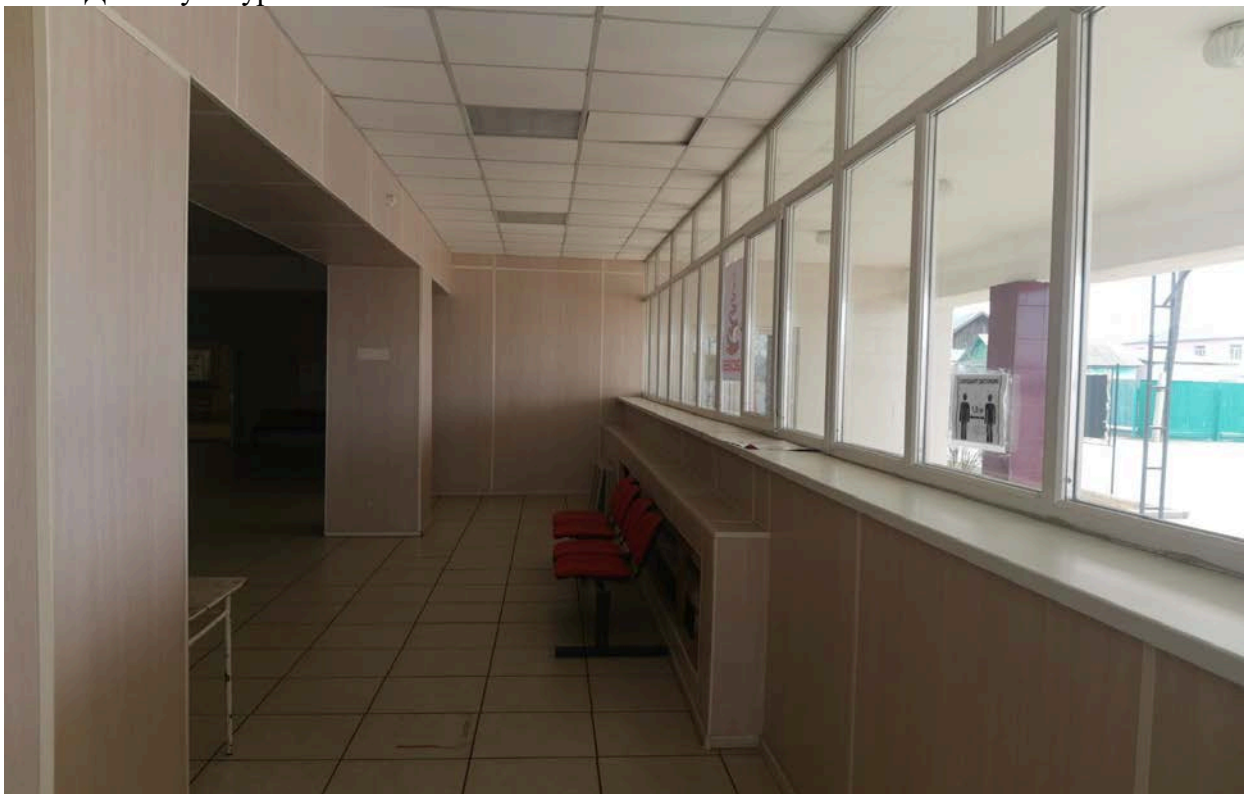
Фойе Дома культуры.