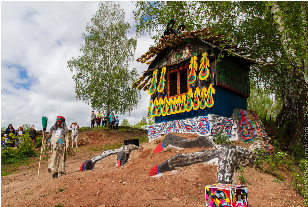
В селе Холмогорское около реки Береш находится избушка Бабы Яги