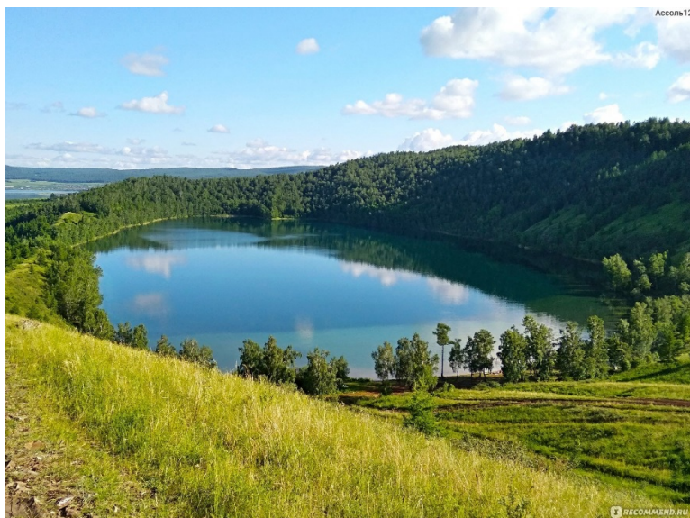
Озеро Линёво находится недалеко от деревни Линёво