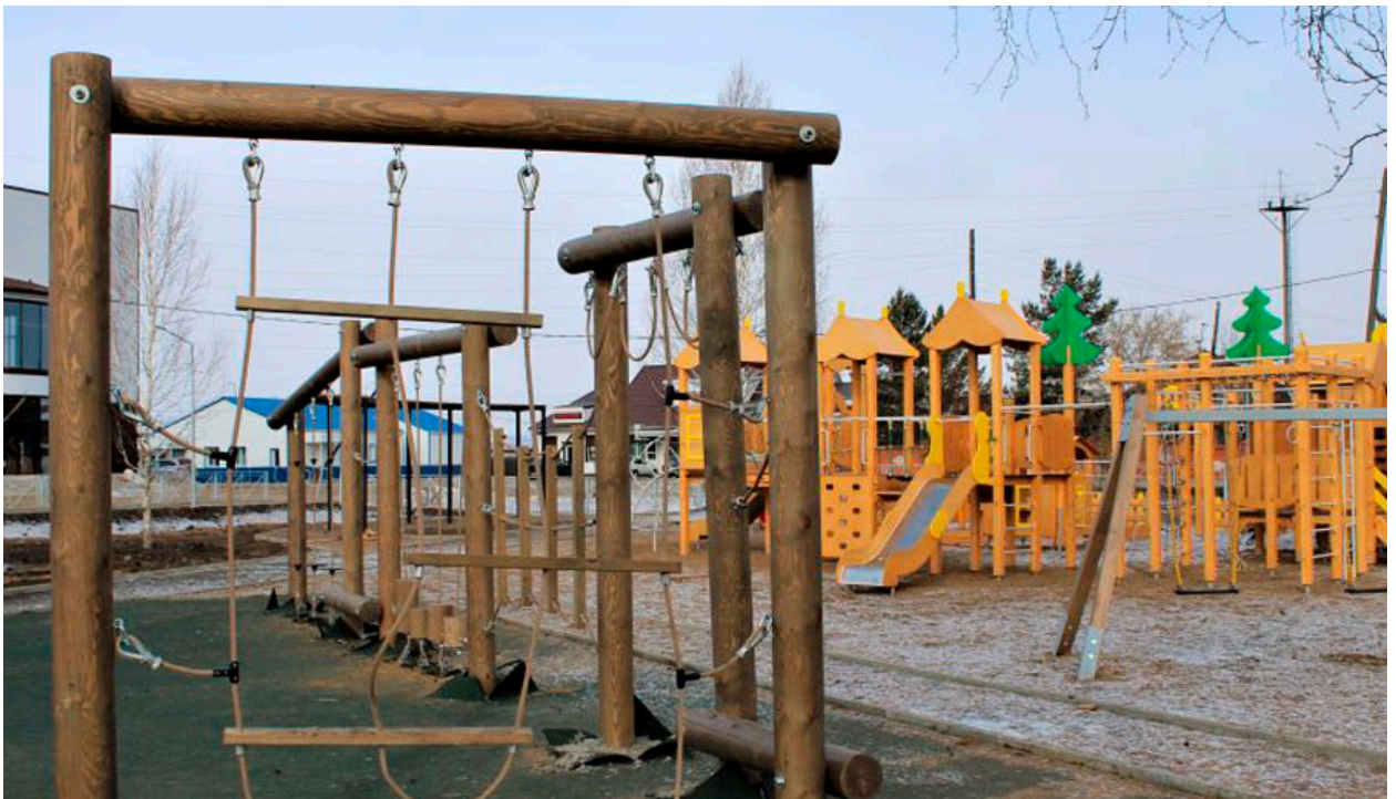
Парк со спортивным комплексом